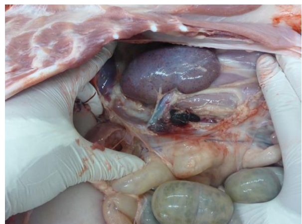
Einblutungen in die inneren Organe wie hier: Niere und schwarze Lymphknoten

Grundsätzlich ist zu beachten, dass Schwarzwildaufbrüche seuchensicher entsorgt und nicht an Luderplätze oder Kirtungen ausgebracht werden. Ausführliche Informationen zu den Biosicherheitsmaßnahmen auf der Jagd finden Sie in der „Kleinen ASP-Fibel“.